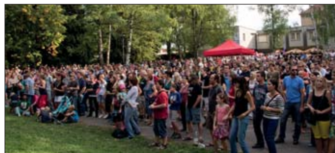
KONCERT HUDEBNÍ SKUPINY MŇÁGA A ŽĎORP