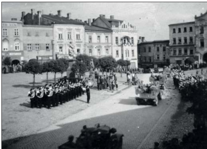
10. 10. 1938, Němci v Příboře vítají okupanty