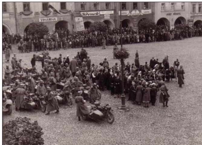
1938, okupanti na příbořském náměstí