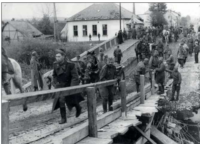
6. 5. 1945, vojáci Rudé armády přecházejí přes zničený klokočovský most