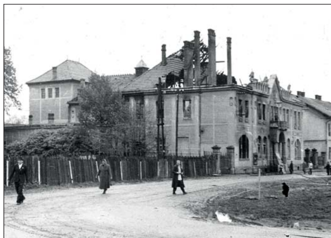
1945, v noci z 5. na 6. 5. shořela střecha Katolického domu