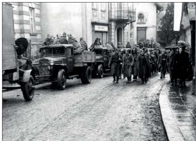
6. 5. 1945, vojáci Rudé armády v Místecké ulici