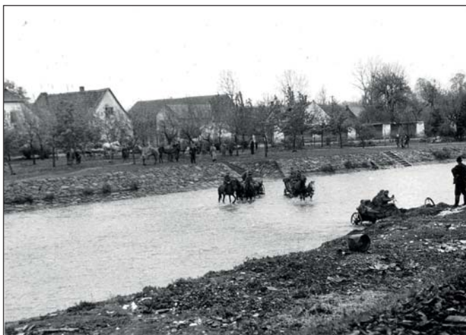
6. 5. 1945, vojáci Rudé armády přecházejí Lubinu