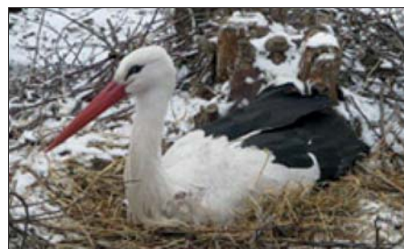
Žáci IV. A ZŠ Npor. Loma Příbor.

Prohlídka končila u rybníčku, kde jsme pozorovali vodní ptáky. Exkurze se nám líbila, hodně jsme se dozvěděli o ptáčích i o práci zaměstnanců stanice.