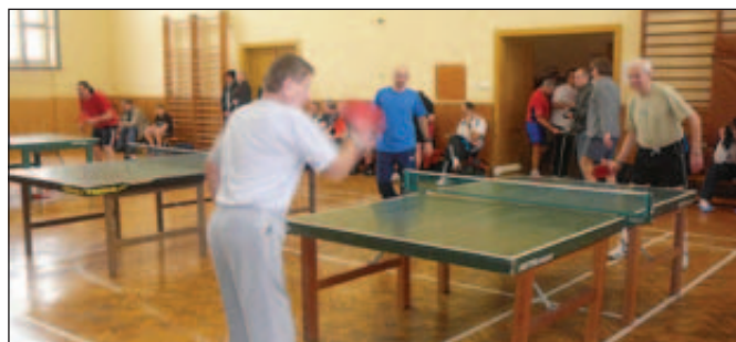
Turnaj neregistrovaných hráčů ve stolním tenise.