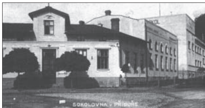
Sokolovna - původní.

V rámci oslav bude také uspořádána malá výstava z historie Sokola, zejména pak příborského.