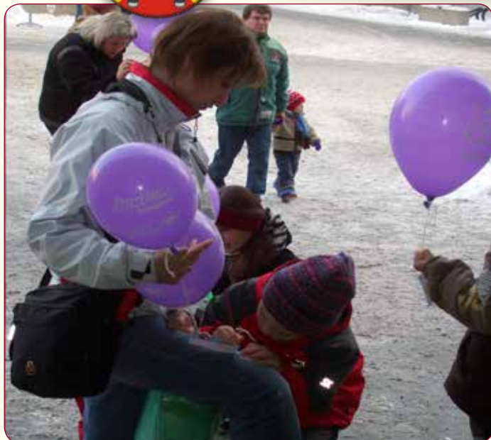
Přání Ježíškovi si děti a také dospělí psali přímo na místě. A psali, jak jen to šlo a kde to šlo.