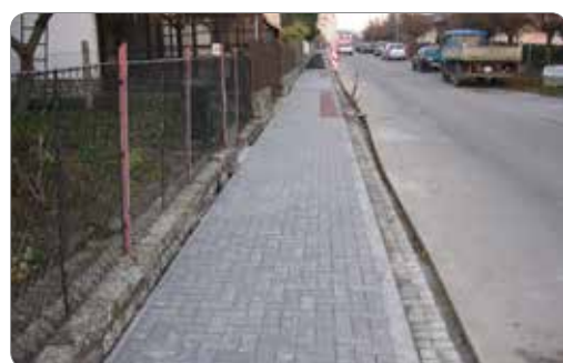
Ulice 28. října.