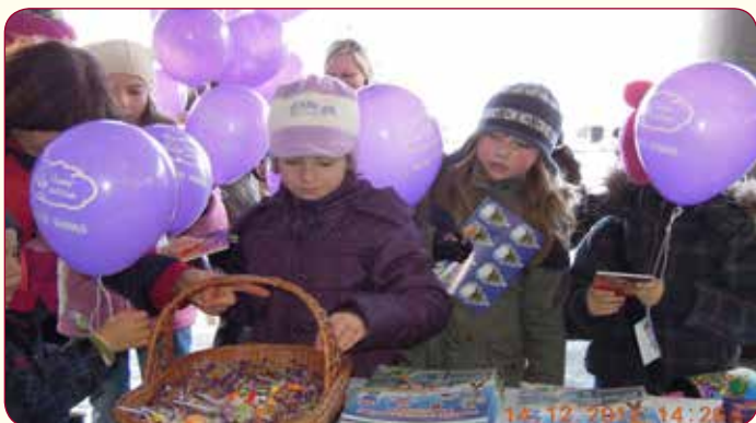
Bonbony a malé dárečky dětem nadělovali strážníci městské policie.

Příbor se 14. 12. 2012 poprvé zapojil do akce „Vypouštění balonků s přáním k Ježíškovi“. Tato akce byla součástí projektu Český Ježíšek. Zároveň byla pokusem o překonání rekordu ve vypouštění balonků v České republice z r. 2008. K nebi jich tehdy vzletlo přes 100 000. Letos si balónek s přáníčkem děti i dospělí vyzvedávali ve vestibulu radnice již od 14. hodiny. Připravených bylo 400 balonků. Dalšíh sto se nafukovalo v chvíli, kdy na náměstí začaly proudit další davy lidí! V 15:15 hodin se v centru města vzneslo do vzduchu 480 fialových balonků. Pár jich ulétlo dětem už pod podloubím. Děti v Příboře také dostávaly drobné dárečky, a to přímo z Ježíškovy dílny. „S Ježíškem bezpečně na cestách“ se vydali se strážníky Městské policie Příbor. V této chvíli ještě nevíme, zda byl překonán rekord, ale organizátoři předpokládali, že podle počtu přihlášených měst a organizací tak tomu bude!