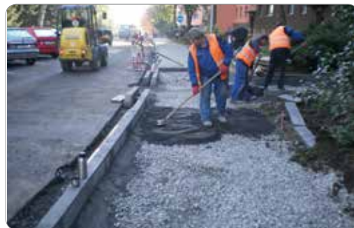
Ulice Npor. Loma.