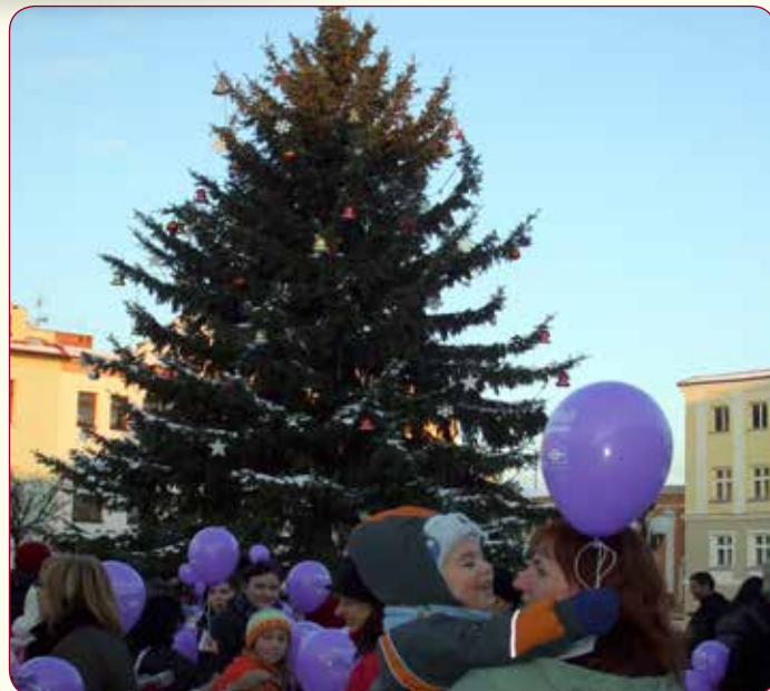
Před 15.15 hodinou všichni čekali uprostřed náměstí na povel, kdy měli pustit balonky k nebi.