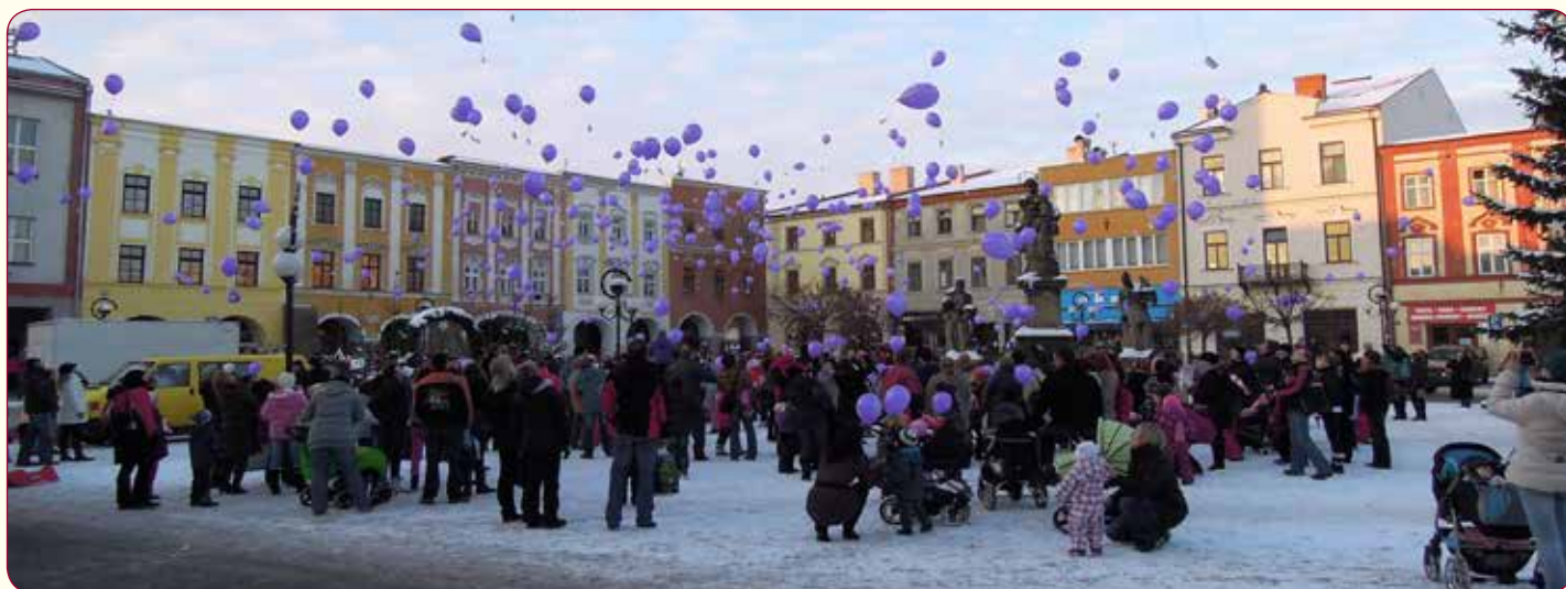
Přesně v 15.15 hodin odstartoval vzlet balonků k nebi prostřednictvím rádia Impuls Václav Vydra. V Příboře se vzneslo k nebi téměř 500 balonků.