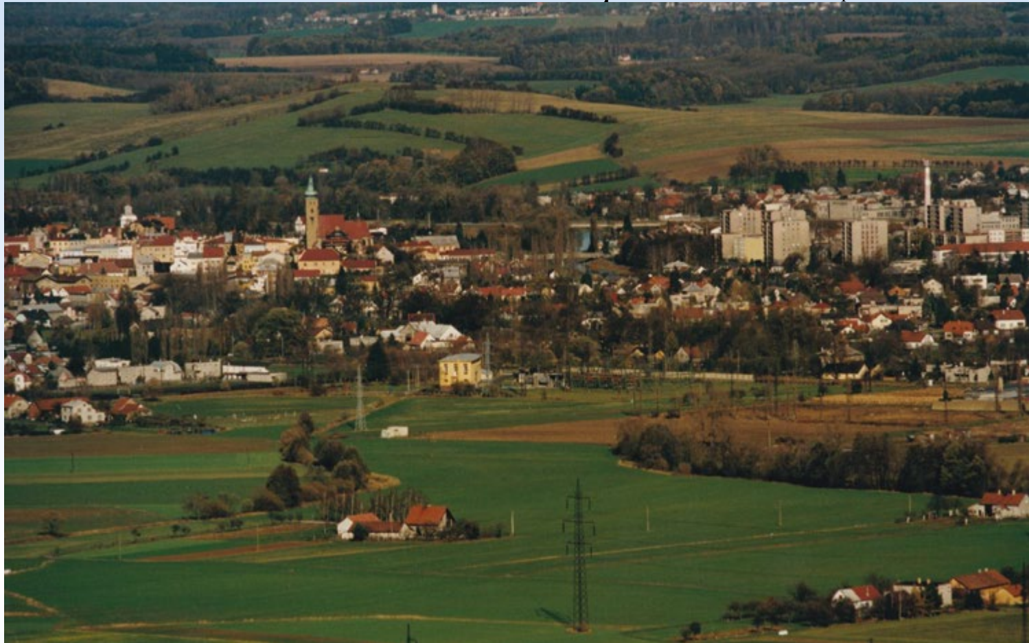
Příbor v prvních letech fungování městské policie. Rajónem působnosti strážníků byl Příbor i jeho části Hájov a Prchalov, foto: Jan Svoboda

8. 10. 1991 Městská rada Příbor rozhodla zřídit městskou policii. 5. 12. městské zastupitelstvo návrh schválilo.