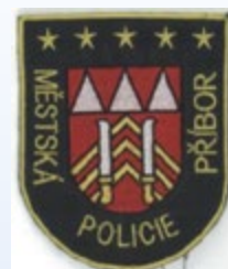
Původní znak, hvězdičky znamenaly počet zakládajících členů MP.

Do výběrového řízení na velitele se přihlásilo 5 zájemců, na strážníky se přihlásilo 11 mužů.