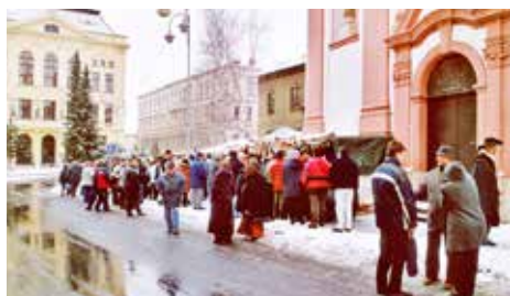
Pouť v roce 2004

Snaha obnovit tradiční starobylou svatovalentinskou pouť v Příboře, která vznikla v 17. století a pokračovala přerušovaně ve 20. století, se objevila záhy po sametové revoluci.