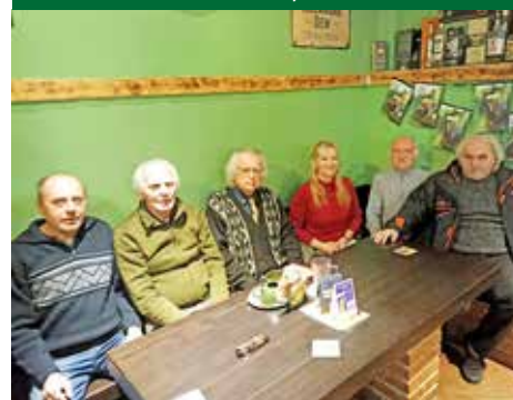
Členové AK v Příboře na výroční schůzi 2025

Republik) nach Brno transportiert wurden, Geschiebekunde aktuell, č. 2, Hamburg/Greifswald, květen 2024.