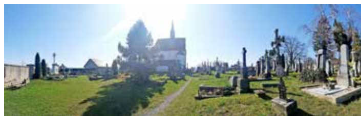
Starý hřbitov dubna 2021