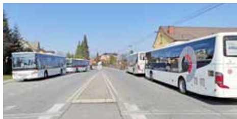
V jeden čas se setkávají autobusy ze čtyř směrů na jedné zastávce a umožňují tak vzájemné přestupy.

Pavel Netušil, radní města Příbora pro dopravu a životní prostředí, i foto