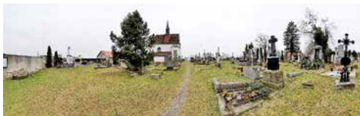
Starý hřbitov března 2021