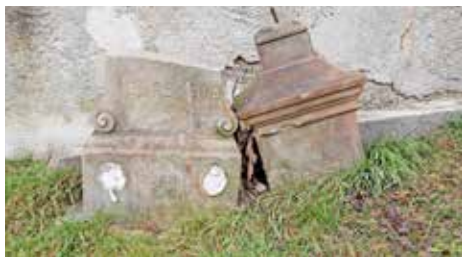
Náhrobek u zdi