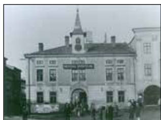
Budova staré radnice, v měšťanském domě č. 19