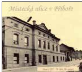
Dům č. 287