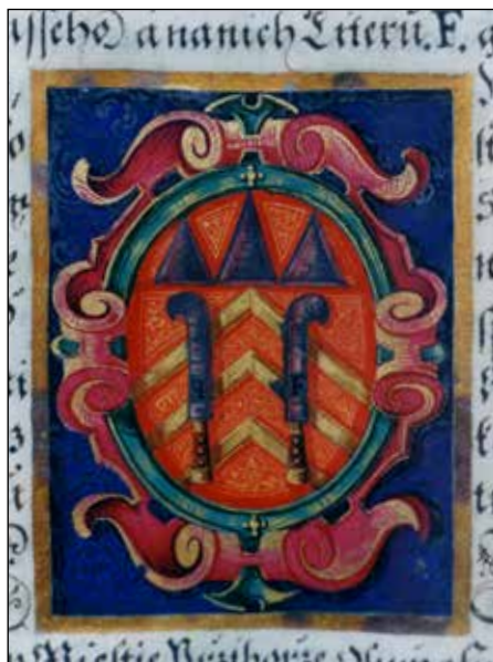
Polepšený znak města Příbora