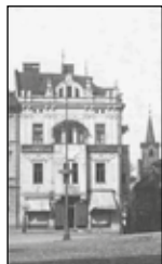
Dům č. 35

Jedním z nich je zahájení provozu prvního poštovního úřadu v našem okrese Nový Jičín. První pošta byla skutečně otevřena v našem městě, a sice 1. 6. 1785 na náměstí v měšťanském domě č. 35 . V tomto domě sídlil poštovní úřad v letech 1785–1835. Dům později koupil peněžní