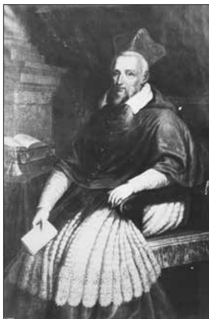
Kardinál Fr. Ditrichštejn