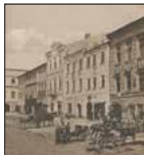
Severní strana náměstí, dům č. 30