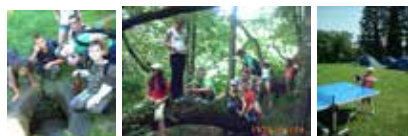
Přihlášku a zálohu 1.000,- Kč www.bavklubpribor.cz

Vážení rodiče, milé děti i letos pořádáme stanový tábor v BAV klubu kde na Vás čeká pestrý program - hry, soutěže, sportovní a zábavné prvky, tajuplné výpravy a výlety, diskotéka, tvoření, noční stezka odvahy a další zábava. Dalším programovým zpestřením bude hra na africké DJEMBÉ bubny, jízdy s RC - radiově řízené modely aut.