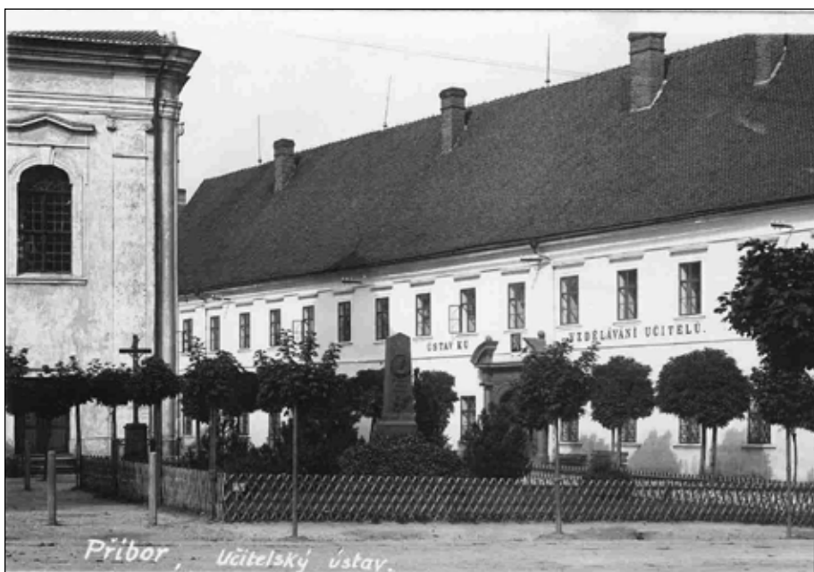
Učitelství ústav v klášteře, pohled r. 1927