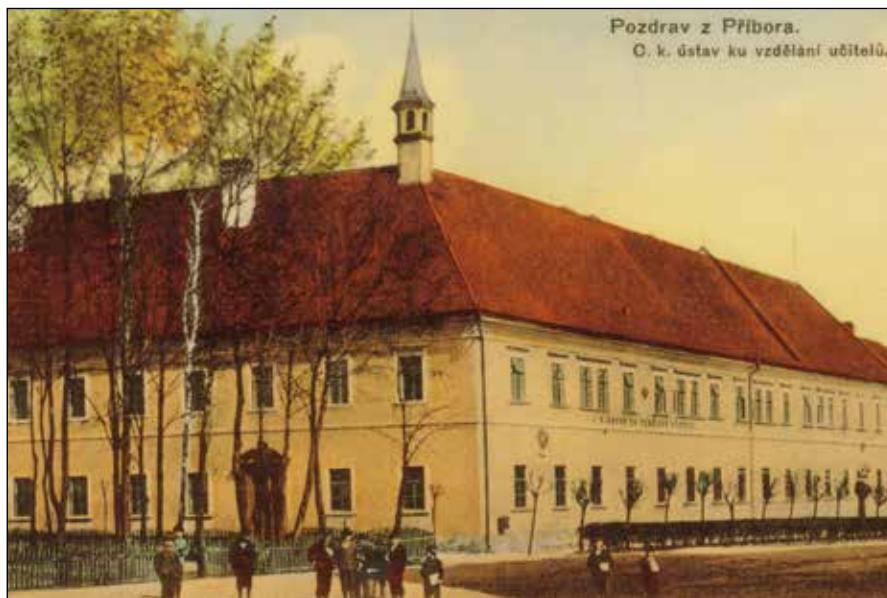
Učitelství ústav v klášteře, pohled před r. 1918