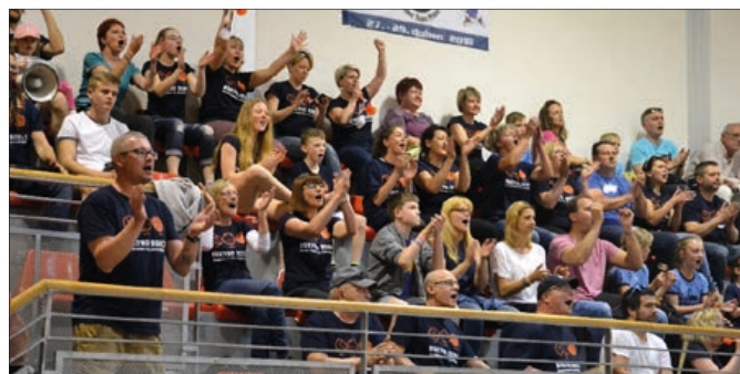
Sportovní hala Masarykova gymnázia v Příboře byla všechny tři dny turnaje plná k prasknutí.

V Local TV Příbor 20. zpravodajství s premiérou 13. 5. 2018, www.televize-pribor.cz