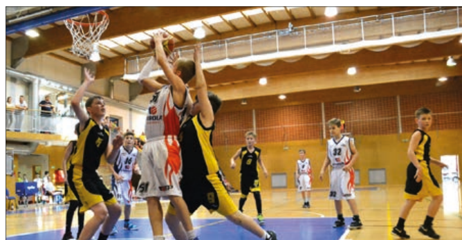
V souboji o 5. místo porazil TBT Příbor soupeře z Vysočiny.