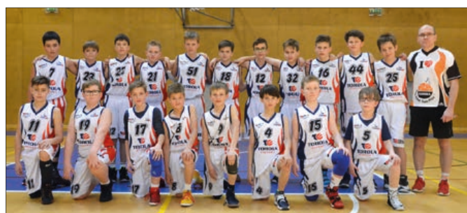
Tým chlapců Torola Basket Team Příbor U12 obsadil v Národním finále 5. příčku.