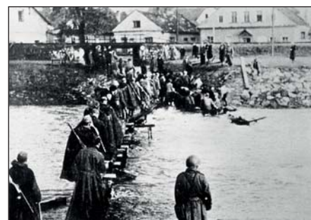
3. Rudá armáda zdolávala Lubinu i z Benátek do Nádražní ulice.