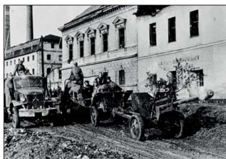
1. Vojáci vstoupili do Příbora z Klokočova nad splavem - asi tak v místě, kde je dnes sběrna, a odtud Místeckou ulicí k mostu. Na snímku Reiserova továrna (komíny).