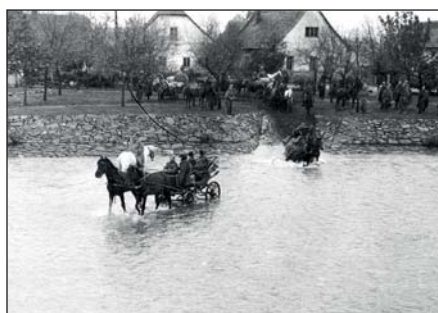
2. Druhým přechodem byl brod - asi tak mezi dnešním pomníkem Rudoarmějců a bývalým Riccem. Tam procházeli vojáci z ulice Na Draháč.