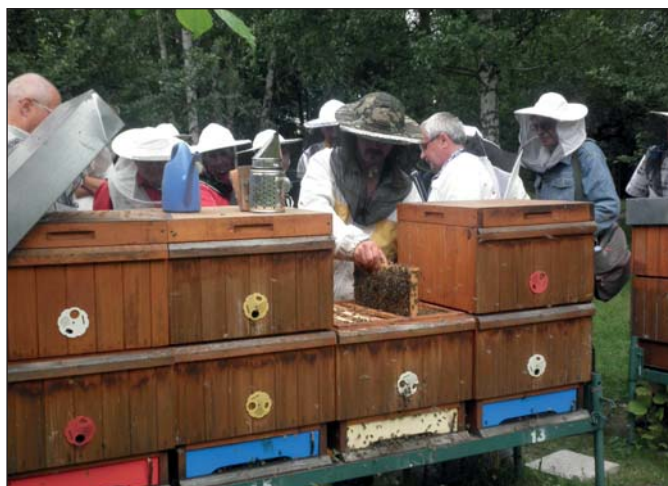
Příborští včelaři si ve včelnici v Libáni prohlédli, jak to dělají jejich kolegové.

Základní organizace Českého svazu včelařů (ZO ČSV) Příbor uspořádala pro své členy exkurzi do Středního odborného učiliště včelařského – Včelařského vzdělávacího centra v Nasavrkách v centru Chráněné krajinné oblasti Železné hory.