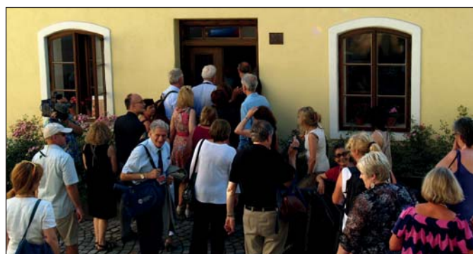
Velký zájem byl o prohlídku rodného domu S. Freuda.