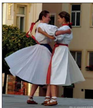
Ostravica na příbořském náměstí.