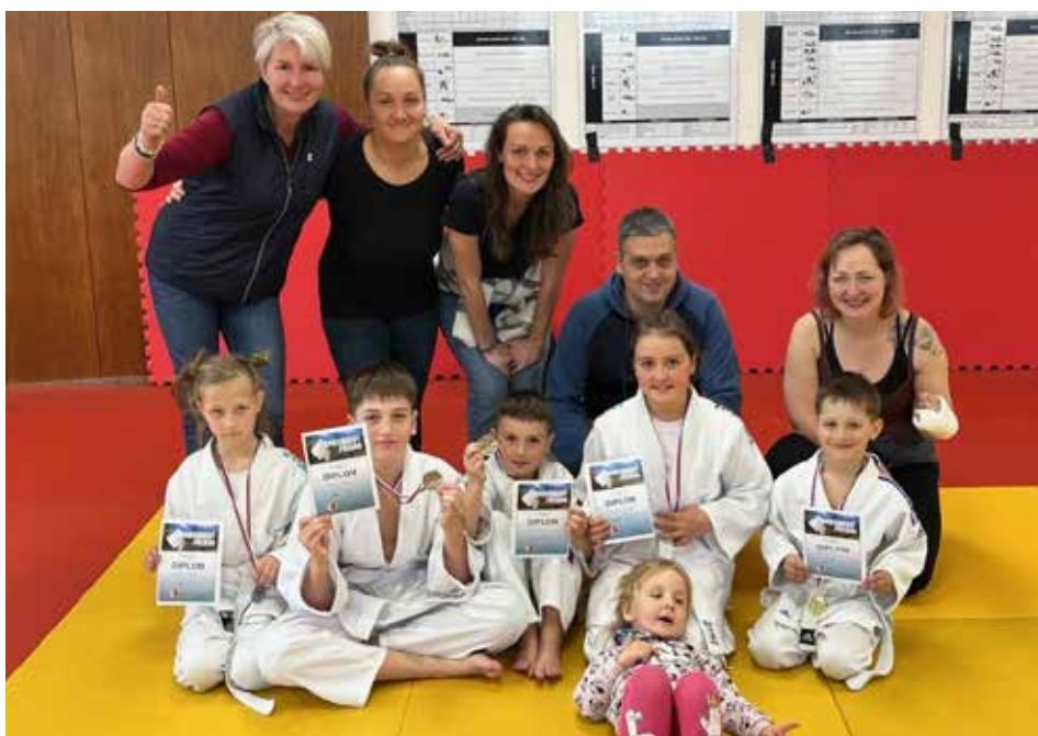
MKM Judo na závodech v Orlové

Těší nás stabilní a rostoucí členská základna. Děti se navzájem podporují a velkou zásluhu na dobré atmosféře mají i rodiče, kteří pomáhají nejen při trénincích, ale i organizačně. Společně tak vy-