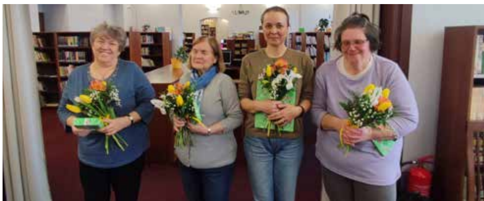
Vítězky čtenářských kvízů

V současné době v knihovně probíhá výměna koberců. Z tohoto důvodu máme vystěhováni veškeré knihy i regály, takže knihovna je momentálně zavřená. Veškeré výpůjčky budou čtenářům prodlouženy až do otevření v měsíci červnu.