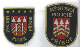
Znak MP kdysi a dnes

* Počet hvězdiček na původním znaku policie znamenal počet zakládajících členů městské policie