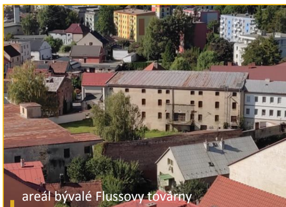
areál bývalé Flussovy továrny