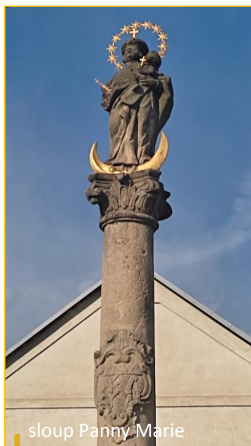
sloup Panny Marie