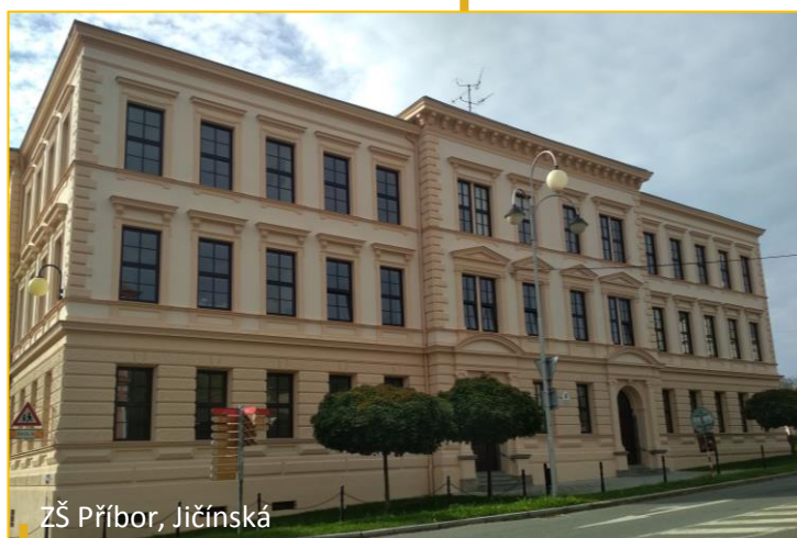
ZŠ Příbor, Jičínská