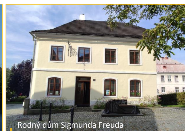
Rodný dům Sigmunda Freuda

Následující údaje dokumentují příklad finanční účasti města Příbora na obnově památkových objektů spolu s podílem státu v letech 2018–2022.