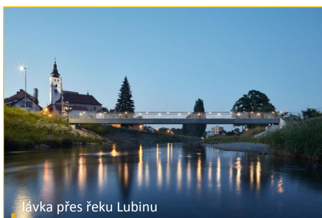
lávka přes řeku Lubinu