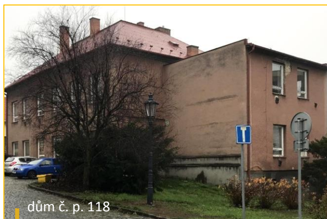
dům č. p. 118